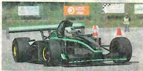
Un petit air de Pikes Peak pour la Lola de Bergerand.

Prochaine épreuve: Slalom de Chamblon, le 17 juin.